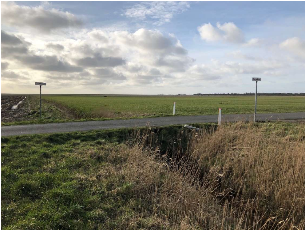
Foto fra besigtigelsen taget mod vest - på vejskiltene står Enderupvej hhv. Sprækvej. Rørlægningen sker på den nærmeste side af vejen.

Der vil ikke efter forlængelsen kunne opstå vegetation af vandplanter i de rørlagte 2 m pga. udskygning. Esbjerg Kommune betragter dog strækningen som en forholdsvis lille del af det ret ensartede vandløb.